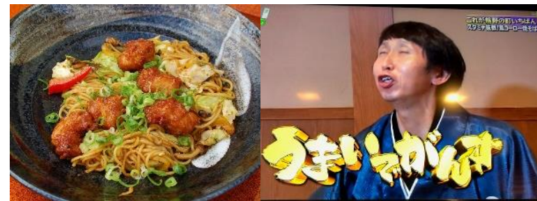
熊野町 B 級グルメ 鳥コーロー焼きそば

RCCTV 番組の元就。に取り上げられて今「鳥コーロー焼きそば」があつい。おかげさまでたくさんのおいしいをいただいております。アンガールズの山根さんも「うまいでがんす〜!」。