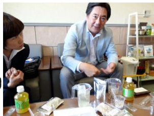
丁寧に商品を説明していただきました。焼きだしぶくの商品が表彰されています。興味深い商品ばかり!!